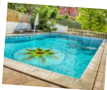
Basen Hotelu Pineta