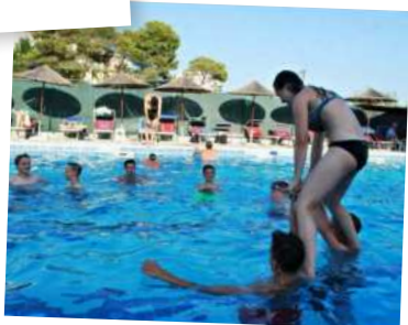
Basen w Kolaveri