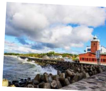
Latarnia Morska Darłowo