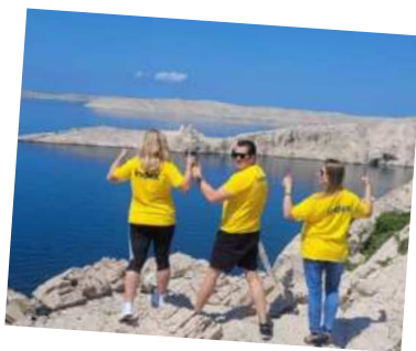
Index na Pagu!