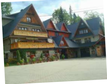
Pensj. Tatrzańska Grań