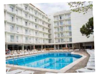
Hotel Don Juan