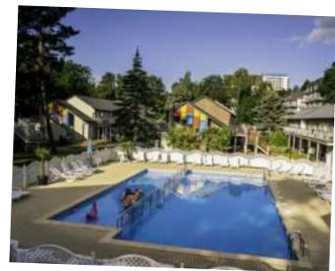
Ośrodek STILO !