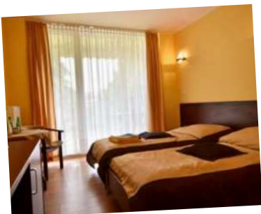
OW „Słoneczny Brzeg”