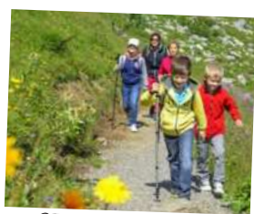
STREFA MAŁEGO ODKRYWCY