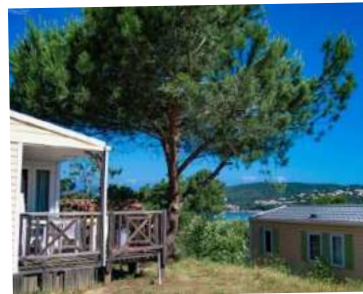
Camping Le Sud